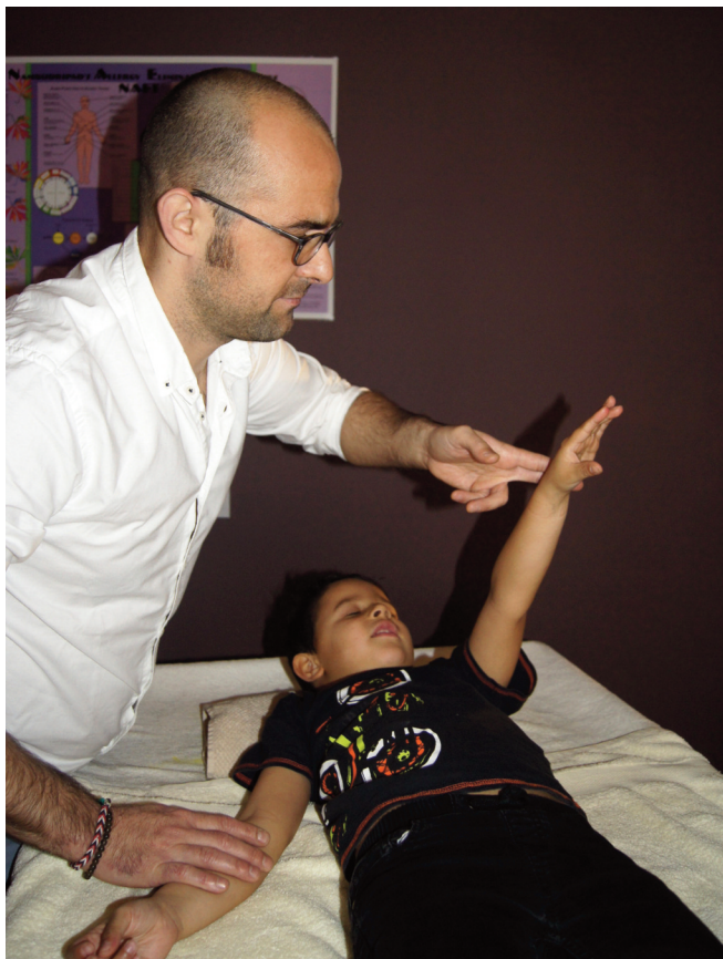
Le test musculaire est un instrument de biofeedback pour déceler les blocages

Propos recueillis par Valentine Kuntschen